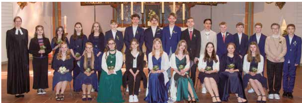
Gottes Segen für unsere Konfirmandinnen und Konfirmanden! Sie wurden am 30. April in St. Johannis konfirmiert.